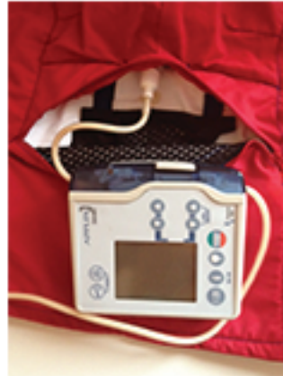
Bilde 3. Gjør slangesettet mellom ernærings- posen og pumpen så kort som mulig, og koble ernæringsettet sammen med pumpen.