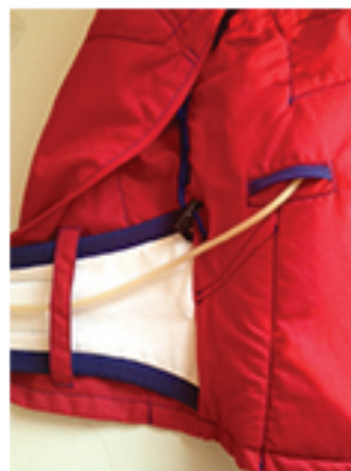
Bilde 7. Tre slangesettet gjennom hengen som vist.