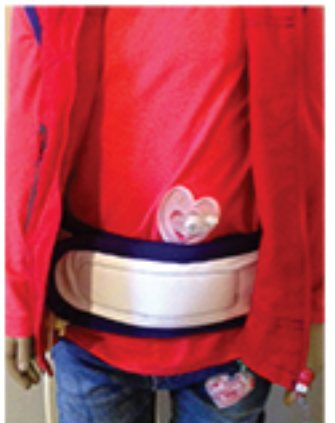
Bilde 8. Koble slangesettet til Knapp/PEG, enten ved å ha slangesettet på utsiden eller på innsiden av beltet for mer beskyttelse.

Overflødig slangesett legges i lommen bak. Pass på at slangesettet ikke kommer i klem.