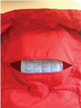
Bilde 1. Putt ernæringsposen i lommen på innsiden av vesten.