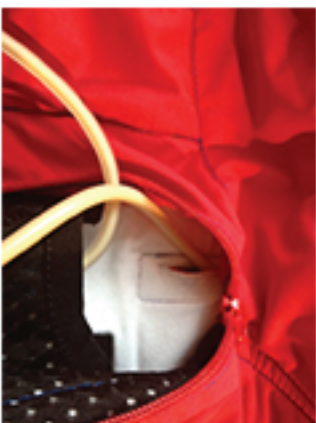
Bilde 5. Putt slangesettet gjen- nom hullet på høyre side av nettinglommen.