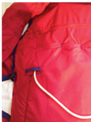
Bilde 6. Trekk ut ønsket lengde på ernæringsettet.