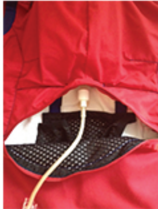
Bilde 2. Koble slangesettet sammen med ernæringsposen, og fyll slangesettet med ernæring.